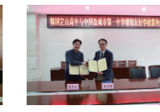
我校与韩国定山高中缔结友好学校签约仪式