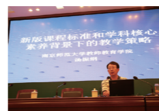
北京大学韦正教授开设《考古中华》专题讲座