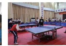
国威乒乓球俱乐部社团活动