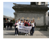
崇文3D考古社团成员寻访安丰古街