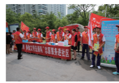
“心社”青年志愿者服务队成员走进社区开展环保宣传活动

学校开发了集知识性、活动性、体验性于一体的十大类38门校本课程，并组建与课程相适应的精品学生社团108个，充分满足学生的个性需求。“墨香书画社”被团省委授予“江苏省百优社团”荣誉称号；崇文3D考古社被北京大学中国考古学研究中心评为“全国优秀考古（历史）社”。