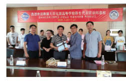
韩国大田老原高中来校访问交流