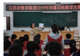
承办“江苏好教育”联盟2019年同课异构教学大赛

学校先后承办省普通高中课程基地现场推进会、2019年省高中校长分专题选学“学校德育与师德修养提升”专题培训班、2019年省高中思想政治青年教师教学基本功大赛和江苏“好教育联盟”2019年同课异构教学大赛，学校影响力和美誉度不断提升。