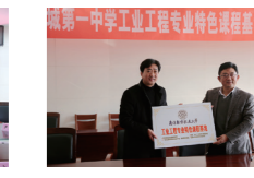
学校与南京航空航天大学举行共建工业工程专业特色课程基地