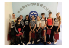
德国茨维考市中学生代表团来我校访问交流