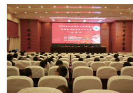
承办2019年省高中思想政治青年教师教学基本功大赛