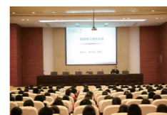
清华大学朱纪洪教授开设《强国梦与清华大学》专题讲座