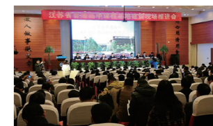
承办省普通高中课程基地建设现场推进会