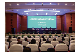
承办2019年省高中校长分专题选学“学校德育与师德修养提升”专题培训班