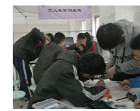
飞鹰无人机社团活动