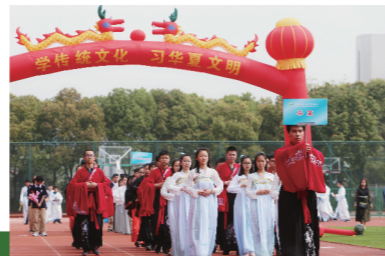
2018年传统文化主题研究运动会之二十四节气

无锡市凤翔实验学校是由区政府为了实现教育高位均衡发展、推进教育现代化而倾力打造的一所九年一贯制“新优质学校”。学校总规划占地面积5.7万平方米，建筑面积3.7万平方米，运动场地面积2.2万平方米，校园清新雅致、惠风和畅，洋溢着浓郁的书香氛围。学校现有62个教学班，在校学生2700余名，教职工200余名。现有江苏省特级教师1名，无锡市名教师2人，高级教师41人，中级教师108人，市、区学科（德育）带头人、教学（德育）能手、教学（德育）新秀等骨干教师50余名，师资力量雄厚。多年来，学校以“办人民满意的教育”为目标，遵循师生身心发展规律和教育发展规律，践行“本色教育”办学理念，力求让每一个孩子都能感受到成长的快乐，成功的机会，力争让每一个孩子能学有所得，学有所成。