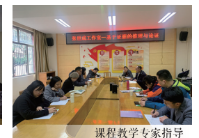
课程教学专家指导