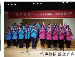
笛声悠扬 绽放青春