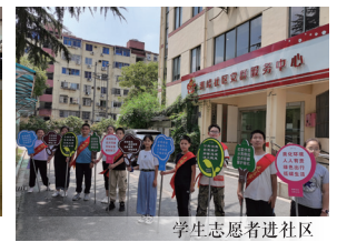
学生志愿者进社区