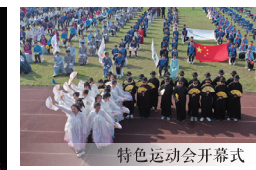
特色运动会开幕式