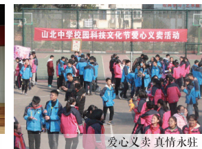
爱心义卖 真情永驻